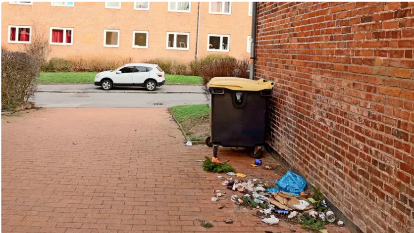
Ungepflegte Außenanlagen an Häusern des Wohnungsunternehmens LEG in Kiel-Gaarden wecken immer wieder Kritik.